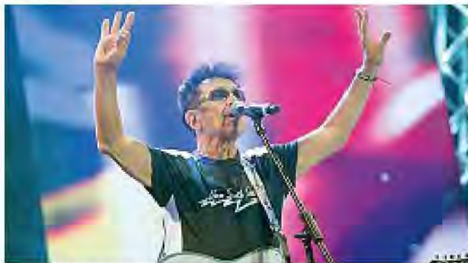
Creberg Anche Edoardo Bennato ha aderito alla serata del 23 novembre

Il ricavato dell'iniziativa sarà devoluto all'associazione «Autismo è...», che a Mozzo si occupa di supportare bambini e ragazzi con disturbi dello spettro autistico e le loro famiglie. In particolare, il concerto servirà a raccogliere fondi per due progetti: l'acquisto di un pulmino a nove posti e l'avvio di un program-