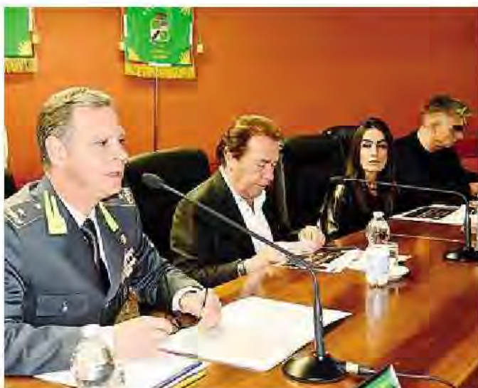
La presentazione del Concerto delle stelle

L'evento è stato presentato ieri durante una conferenza stampa in cui il comandante dell'Accademia generale Bonifacio Bertetti ha illustrato l'iniziativa e le sue finalità. «È per noi l'occasione di festeggiare gli allievi del terzo anno che hanno conseguito il grado di sottotenente e che indossano la prima stelletta. Da qui nasce il "Concerto delle stelle" dove l'Accademia, in questo passaggio nella vita di questi giovani, coglie l'occasione per invitare a un gesto di solidarietà». Il contributo artistico giunge da Radio Italia e dai suoi contatti con i grandi nomi della musica italiana. «È un cast eterogeneo quello di questa edizione - ha spiegato il presidente Mario Volanti -. Passiamo da un nome storico come quello di Bennato a quello di Urso, dal richiamo più